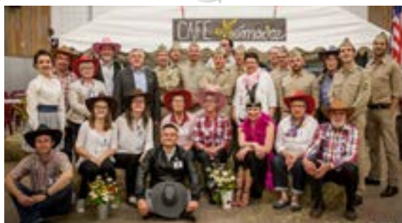
4 e Petit Festival de la Paix dans le cadre des commémorations du 70 e anniversaire de la fin de la Seconde Guerre mondiale. Témoignages au café-théâtre.