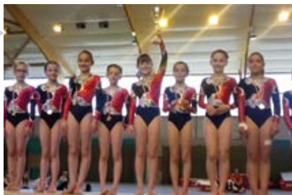
Les poussines bouvronnaises (gym) sont montées sur la plus haute marche du podium et deviennent championnes départementales de leur catégorie.