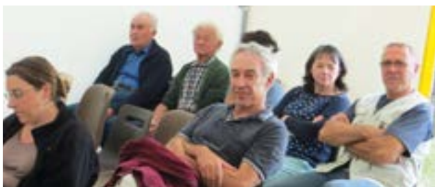
Rencontre avec les habitants de la Violais.

Fin 2015, les élus ont rencontré les habitants lors de comités de villages.