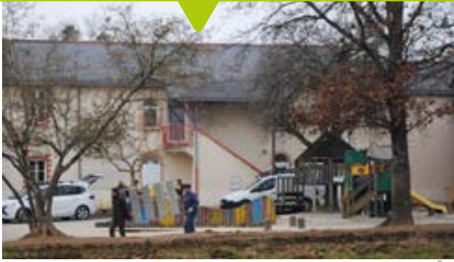
Le déménagement de l'école publique Félix-Leclerc.