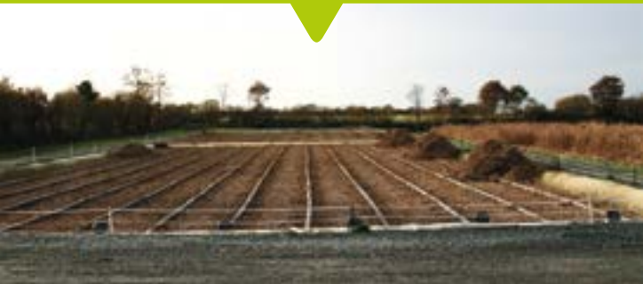
La nouvelle station d'épuration participe pleinement à la reconquête de la qualité des eaux des ruisseaux tout en protégeant l'environnement.