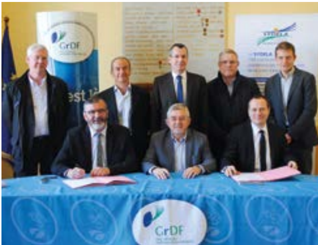
Le maire a signé le 1 er contrat de concession de distribution publique de gaz naturel avec GRDF.