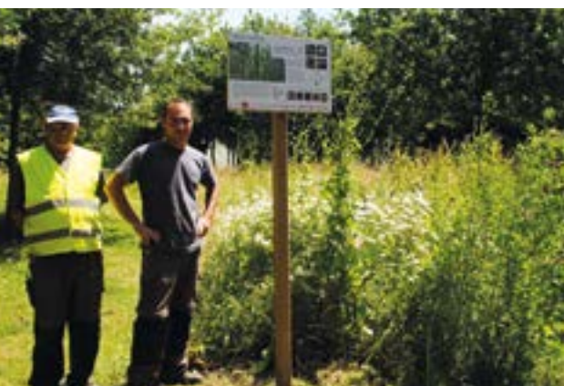
Le 30 mars la Commune a reçu le prix national « commune bio sans pesticides » dans le cadre de la campagne « 0 phyto, 100 % bio ». Ce prix récompense l'engagement dans l'entretien sans produits phytosanitaires et le travail de l'association « les Petits Palais ».