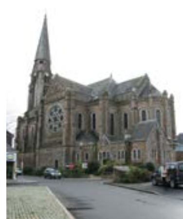
Quel devenir pour l'église ? Le bâtiment a besoin de travaux, réunion publique en avril et lancement de l'atelier de réflexion avec les habitants.