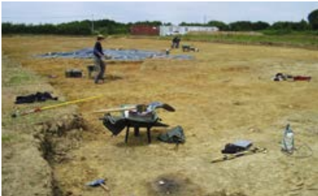
Les fouilles archéologiques marquent le début des travaux de la déviation.