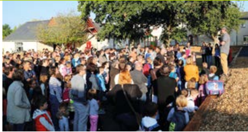
C'est la rentrée dans la nouvelle école.