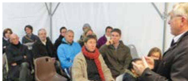
Rencontre avec les habitants de Sordeac.