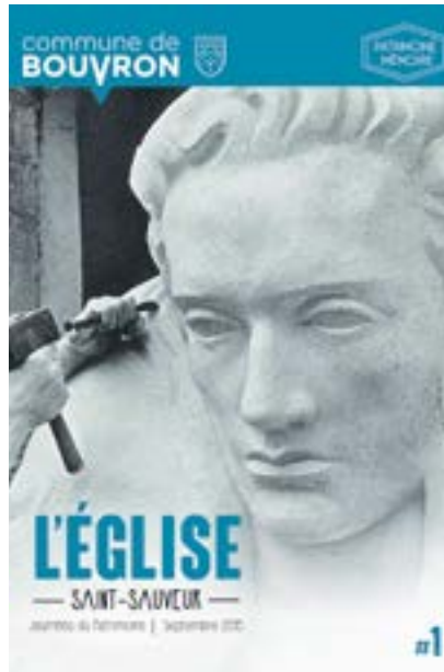
Journées du patrimoine en septembre, découverte du mobilier, des vitraux, des sculptures.