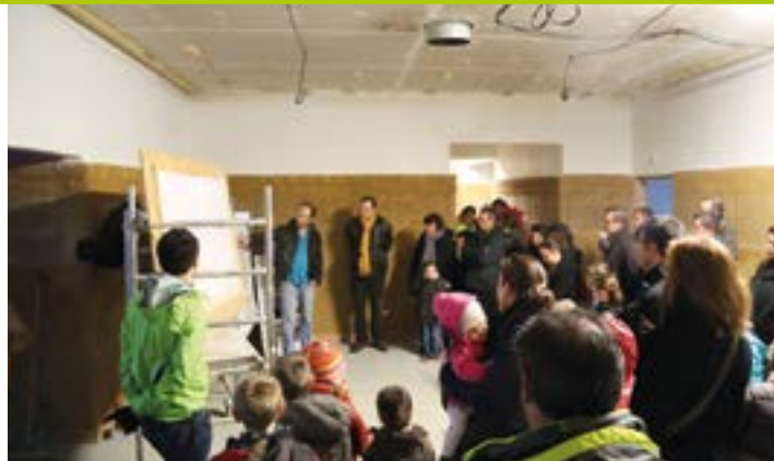
La construction du Pôle enfance se poursuit, les parents d'élèves et les élus visitent le chantier de l'école Félix-Leclerc.