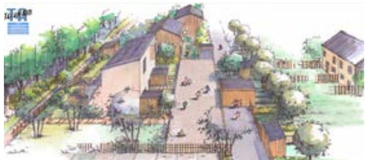
Réunion publique de présentation du nouvel écoquartier de Bardoul qui débutera en 2016 et qui comprendra 114 logements. Début des travaux en 2016.