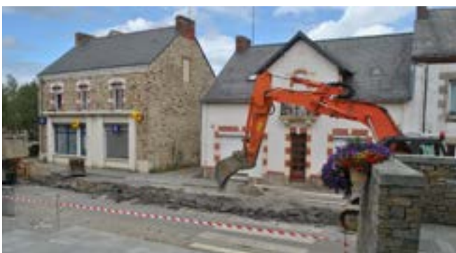
Le gaz arrive à Bouvron.