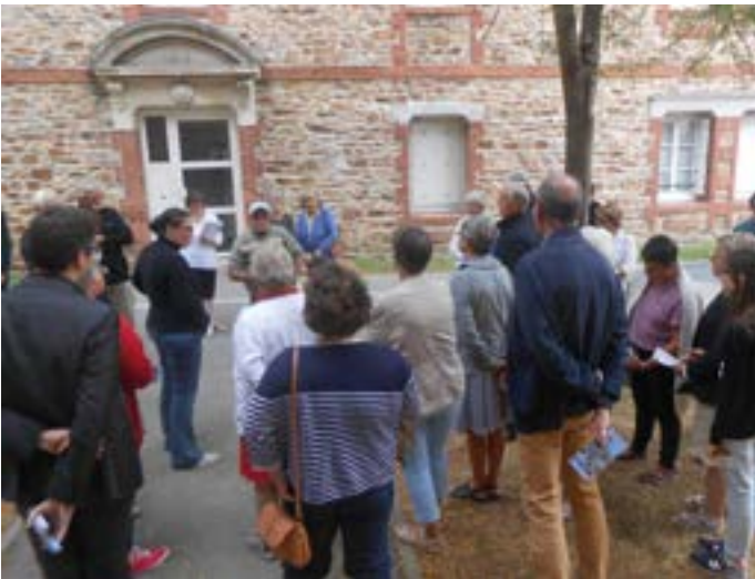
Pourquoi une minoterie à Bouvron ?