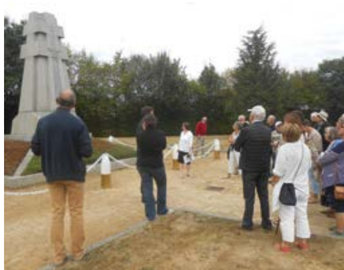
L'Histoire au monument de la Reddition