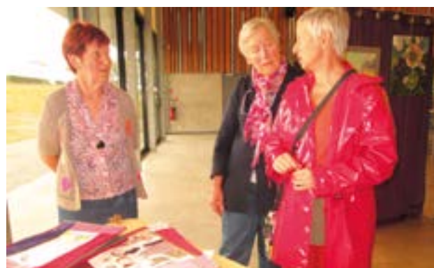
Les sacs en tissu recyclé