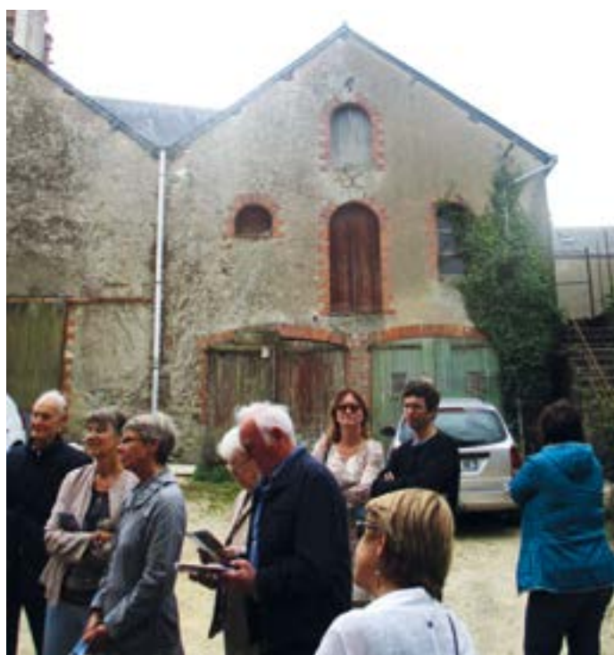
Balade dans le Centre-Bourg, sous un porche, rue Louis-Guihot