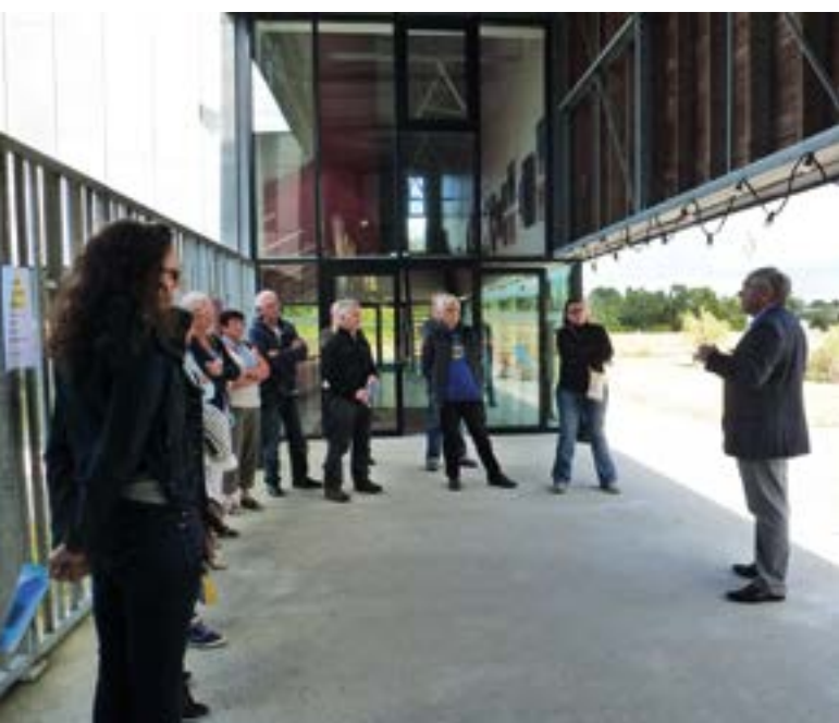
La visite des coulisses d'Horizinc

Une vraie découverte de la trentaine d'artistes à Horizinc'arts et des lieux et des histoires bouvronnaises au détour des rues et de l'église.