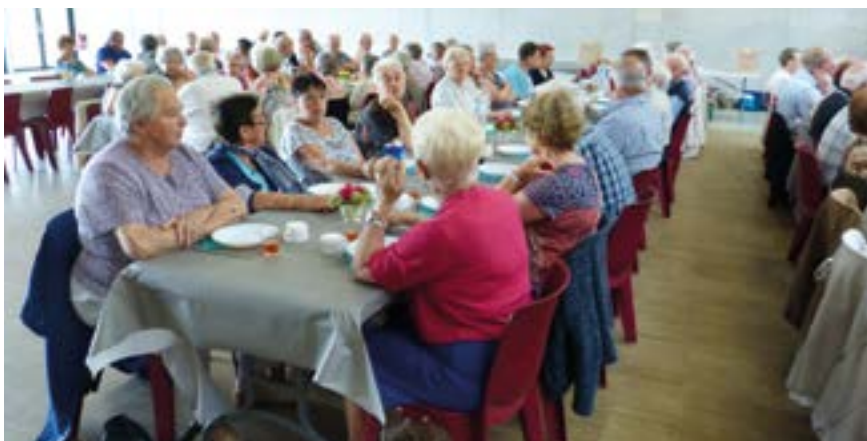
Un moment festif en 2016

Contact : Club Retraite et Loisirs Siège social à la mairie - 12 rue Louis-Guihot. Lieu d'activité : salle de la Minoterie Tél. 02 40 56 34 13