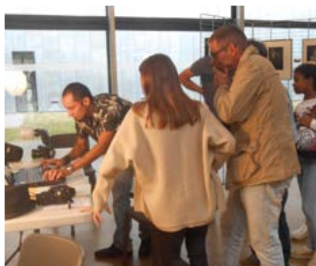
L'atelier photo et les expositions des artistes à l'intérieur d'Horizinc