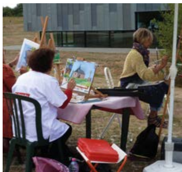
Les peintres dans la prairie d'Horizinc