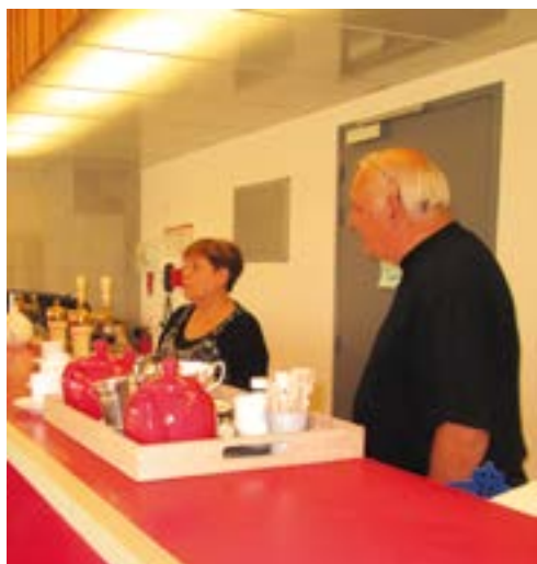
Le bar et sa pâtissière