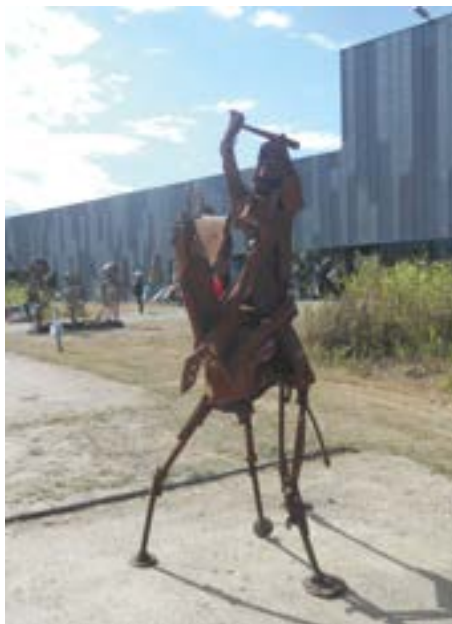
L'accueil sur le site par les chevaliers de Jean Lebeau