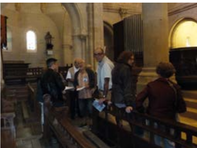
La visite de l'église : découverte des statuts, vitraux, objets liturgiques...