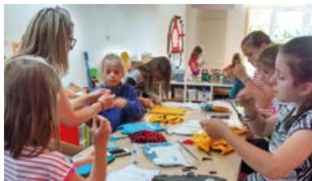
Activités des enfants au périscolaire