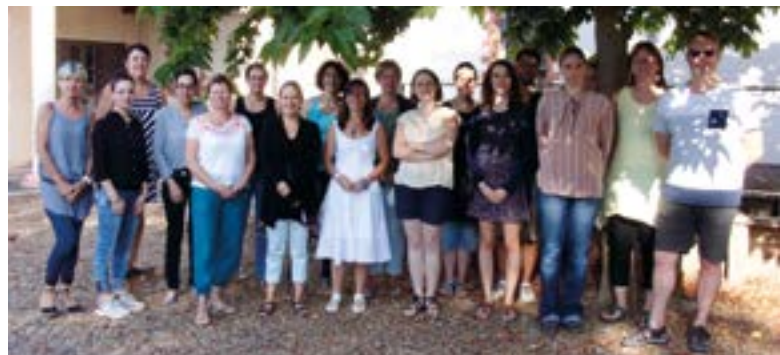
L'équipe pédagogique de l'école Félix-Leclerc

De plus, 2 services civiques vont être recrutés à la fin d'année sur 2 missions : la gestion de la bibliothèque et la citoyenneté.