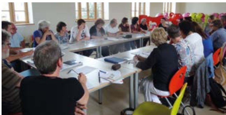
Rencontre du 22 juin 2016

La commune de Bouvron est adhérente à l'association depuis 2008. De nombreux projets municipaux ont bénéficié de retours d'expérience de ce réseau, et à leur tour, des communes adhérentes viennent enrichir leurs propres projets en visitant les réalisations innovantes de la commune, que ce soit le restaurant scolaire, la station de phyto-épuration ou le Pôle enfance. Pour que le Développement Durable rime aussi avec Développement Local, il n'est pas nécessaire de chercher à l'autre bout du globe des solutions que nos voisins souhaitent partager avec nous !