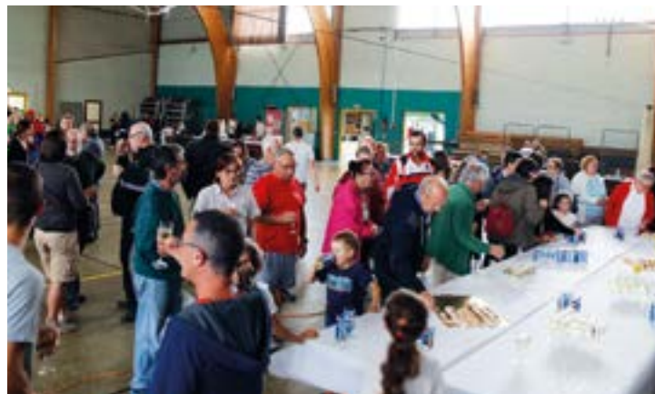
Un moment de convivialité autour du pot