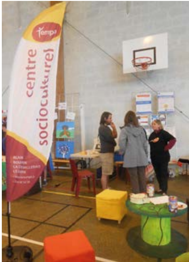
Le CSC Tempo présent au forum des associations le 9 septembre