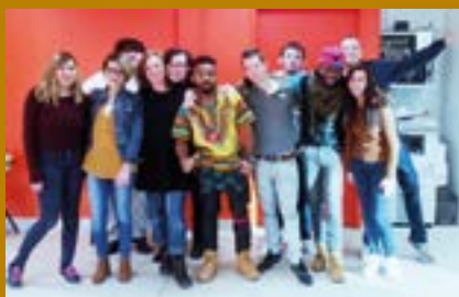
Des jeunes des groupes Garantie Jeunes de Châteaubriant et Nort-sur-Erdre, lors d'un atelier d'expression théâtrale.

Contact antenne de Blain : 02 40 79 99 01