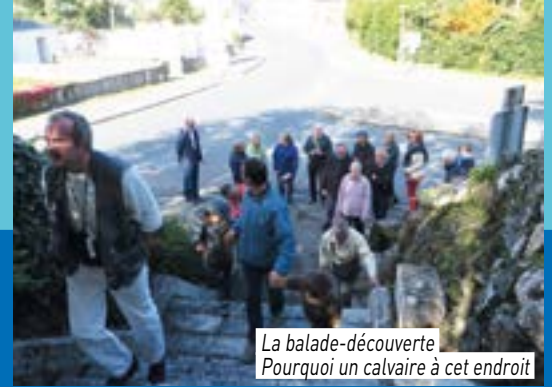
La balade-découverte Pourquoi un calvaire à cet endroit

Samedi 16 et dimanche 17 septembre les nombreuses animations ludiques et culturelles ont attiré petits et grands.