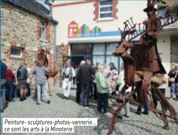
Peinture- sculptures-photos-vannerie... ce sont les arts à la Minoterie