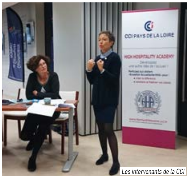
Les intervenants de la CCI

→ Pour l'année 2017, des actions spécifiques en faveur du commerce ont été prévues en partenariat avec la Chambre de Commerce et d'Industrie et la Chambre de Métiers et de l'Artisanat :