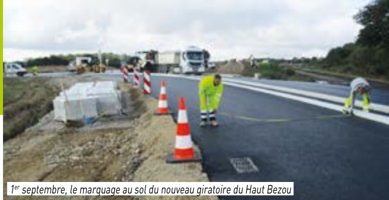
1 er septembre, le marquage au sol du nouveau giratoire du Haut Bezou

ouvrages, la voie communale VC11 traversant le chantier a été fermée et une déviation a été mise en place. Cette mesure de circulation sera mise en œuvre jusqu'à l'achèvement de ces ouvrages, à savoir, février 2018.