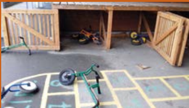
Garage à vélos - École Félix-Leclerc

À Bouvron, dernièrement, on a recensé de multiples effractions : dans le Pôle enfance notamment avec dégradation sur le local vélo et vol de plusieurs vélos d'enfants, intrusion dans l'école maternelle, bris de