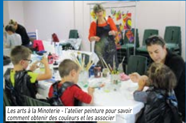
Les arts à la Minoterie - l'atelier peinture pour savoir comment obtenir des couleurs et les associer