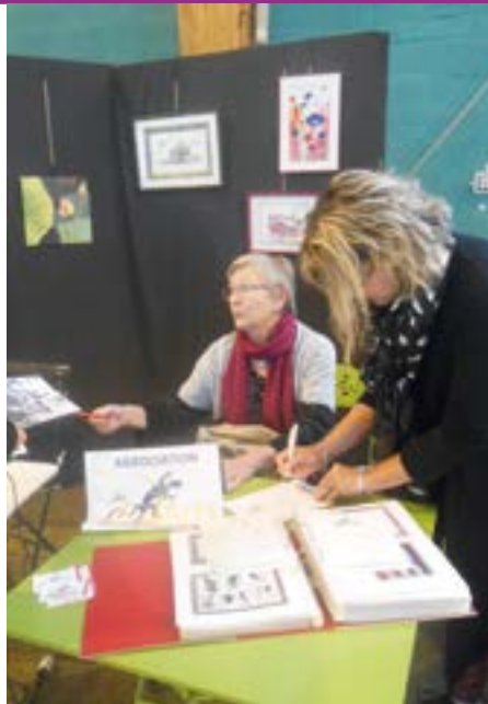
Le stand de peinture