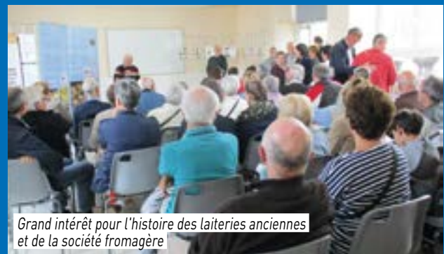
Grand intérêt pour l'histoire des laiteries anciennes et de la société fromagère