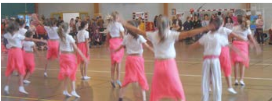
Démonstration de l'association de danse