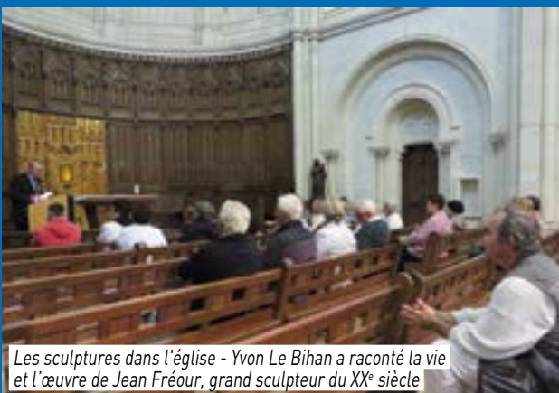
Les sculptures dans l'église - Yvon Le Bihan a raconté la vie et l'œuvre de Jean Fréour, grand sculpteur du XX e siècle