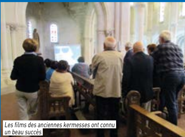
Les films des anciennes kermesses ont connu un beau succès