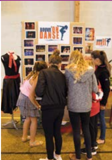
L'intérêt des filles pour la danse...