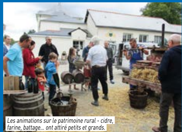
Les animations sur le patrimoine rural - cidre, farine, battage... ont attiré petits et grands.