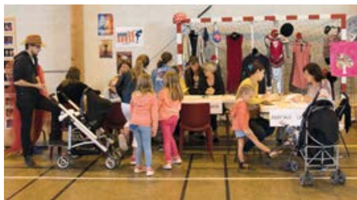
Les inscriptions aux activités