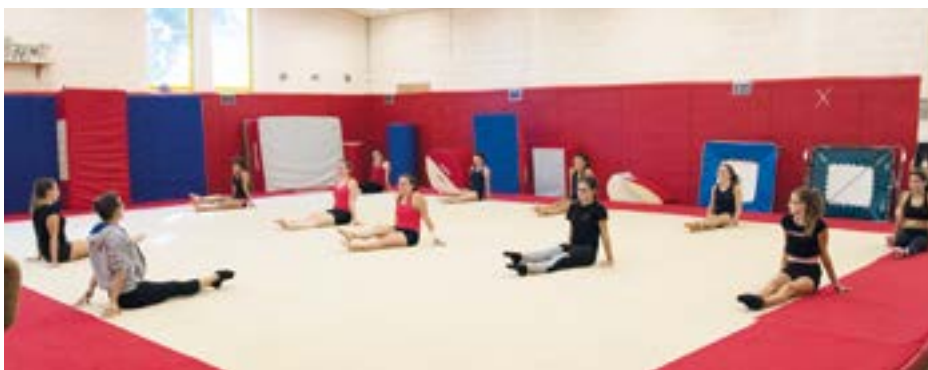
Démonstration de gym