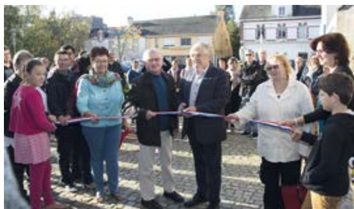
Inauguration de la Maison des Associations samedi 23 septembre