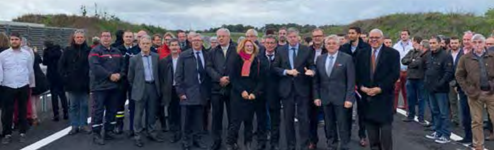
La visite de la déviation par les officiels