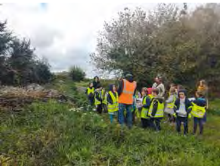
Visite des classes CE2 et CM1 de l'école Félix-Leclerc à l'ouvrage hydraulique de la Farinelais

Les habitants ont été patients, tenaces et ont mis tout en œuvre pour la réalisation de ce projet. L'État a saisi l'importance de cette déviation qui ouvre une nouvelle ère pour Bouvron.