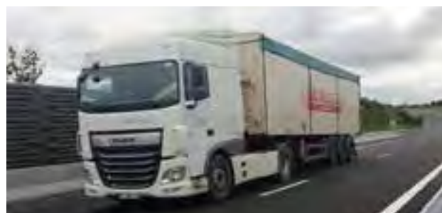
Le premier camion