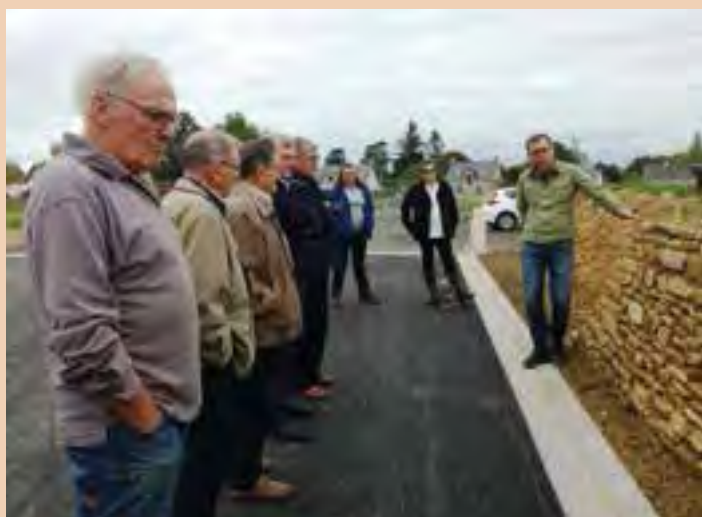
EcoQuartier- 5 octobre 2019 - Signature de la charte et découverte des murs-talus