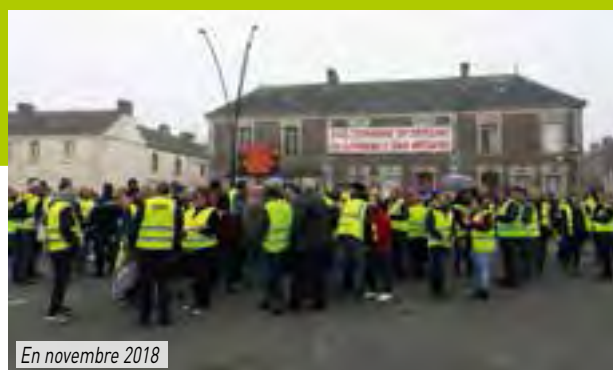
En novembre 2018

La commune a dû acquérir le bâtiment place de la Minoterie, ce qui a nécessité un délai conséquent entre l'évaluation, la négociation et l'acquisition. Puis, le bâtiment appartenant à la collectivité, il a fallu établir une convention de maîtrise d'ouvrage pour réaliser les travaux en vue d'y installer un équipement privé. Et enfin trouver une maîtrise d'œuvre (ISO-CEL) et la faire travailler sur les plans d'aménagement très spécifiques, sur les blindages notamment.