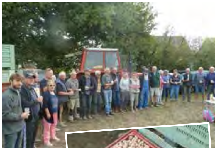
Une belle équipe...

Cette année 2019 , l'équipe a produit des pommes de terre, des potimarrons et des haricots au profit des « Restos du Cœur » de Nantes et de Savenay, et la récolte est d'importance : ce sont environ deux tonnes de pommes de terre qui ont été distribuées. Quelques sacs restent sur Bouvron à la disposition du CCAS.