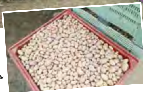
...et une belle récolte

Toute l'équipe accueillerait volontiers tous ceux qui souhaiteraient donner un coup de main pour semer, désherber ou récolter. Et c'est garanti : ils travaillent dans la joie et la bonne humeur !!