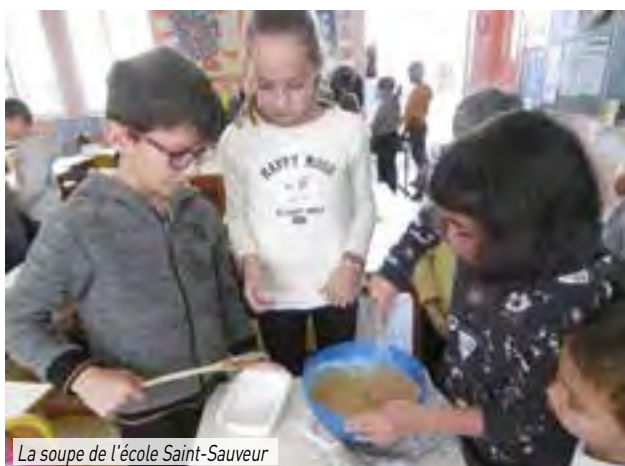
La soupe de l'école Saint-Sauveur

Le marché d'automne a permis la réalisation de bonnes recettes.