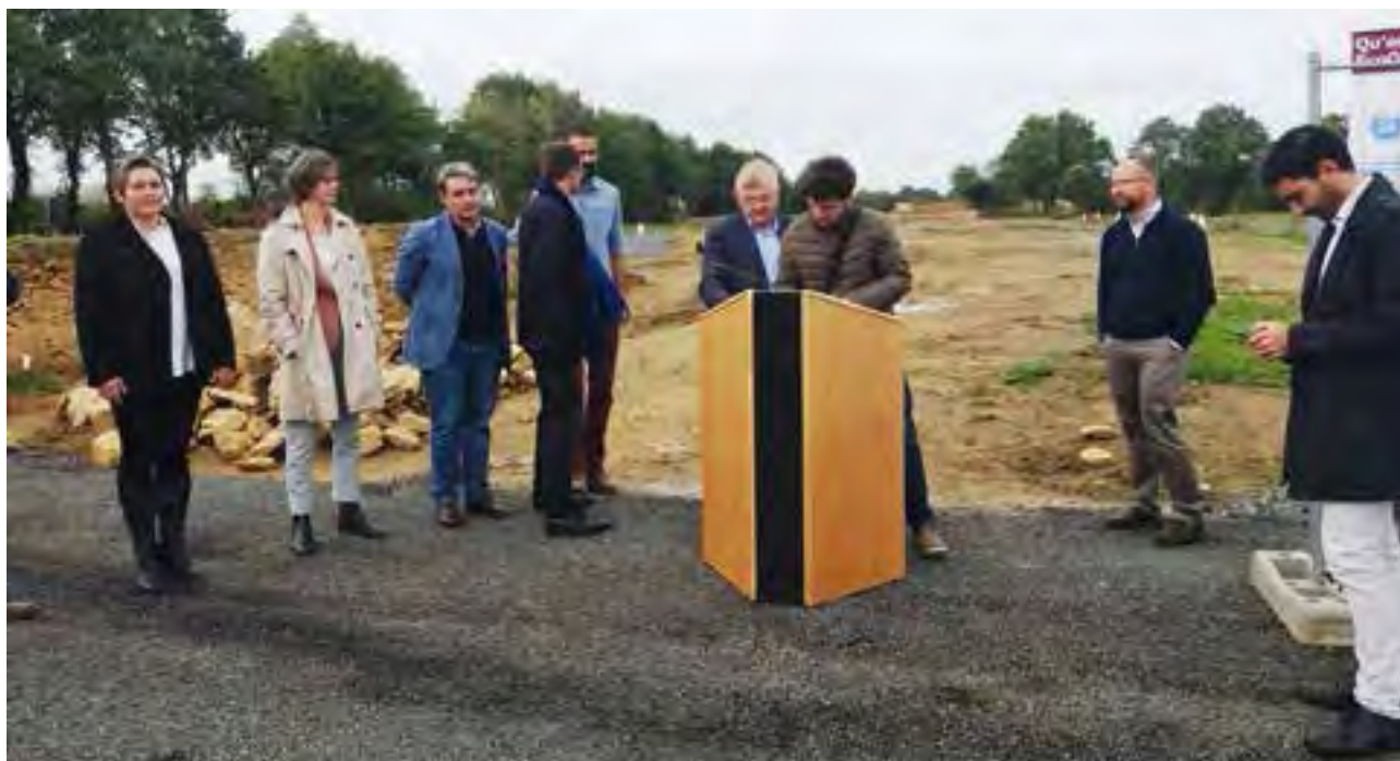
ÉcoQuartier - 5 octobre 2019 Signature charte et commercialisation

Les divers travaux de terrassement et d'aménagement terminés, le 5 octobre dernier, l'ensemble des partenaires et la municipalité ont lancé sur le site la commercialisation des parcelles et signé la charte ÉcoQuartier. Ce projet, auquel s'adjoit celui du réaménagement du Centre-Bourg, a ainsi reçu le « Label ÉcoQuartier – étape 1 ». Ils ont ainsi rejoint les membres du Club ÉcoQuartier.