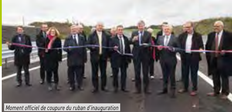
Moment officiel de coupure du ruban d'inauguration

Aujourd'hui, l'inauguration de la déviation de Bouvron marque la fin d'un long processus mais aussi le début de nouveaux engagements encore plus longs, celui de reconstruire pour les 50 prochaines années notre Centre-Bourg avec comme objectif de conforter sa qualité architecturale, ses mobilités, son accueil et ses services proposés.