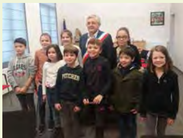
Quelques anciens élus avec les nouveaux élus accompagnés de M. Le Maire :

Cette année encore, il y a eu une forte mobilisation des enfants avec beaucoup d'investissement et de participation de la part de chacun.