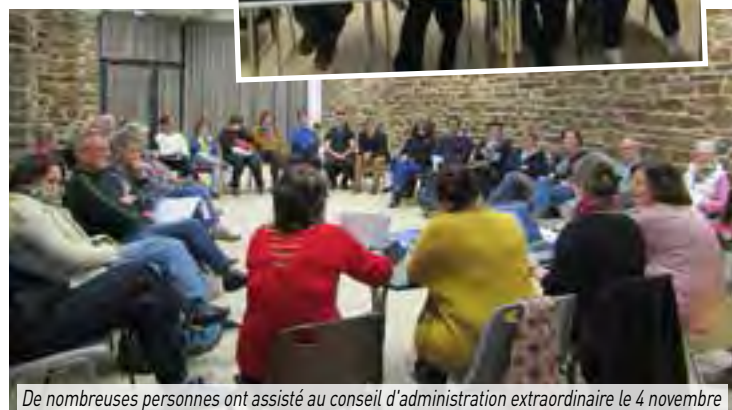
De nombreuses personnes ont assisté au conseil d'administration extraordinaire le 4 novembre

« Nous lançons un large appel à tous les bénévoles pour prendre notre relève. À notre avis il faut garder une co-présidence pour se partager le travail et les décisions, mais aussi il serait très souhaitable que d'autres personnes s'investissent pour former une équipe qui serait chargée d'organiser des événements spécifiques, développer d'autres projets et également pour l'administration : la gestion des salariés, la comptabilité, la réservation des salles... » précisent-elles.