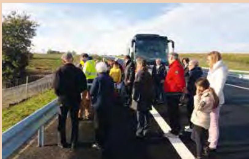
La visite commentée de la construction de la déviation et des mesures environnementales compensatoires qui ont été réalisées

Retrouvez les temps forts de l'année 2019 à Bouvron lors de la cérémonie des vœux le 10 janvier à 19 h 00 à Horizinc.