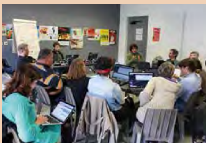
Radio éphémère - Festival de la Paix