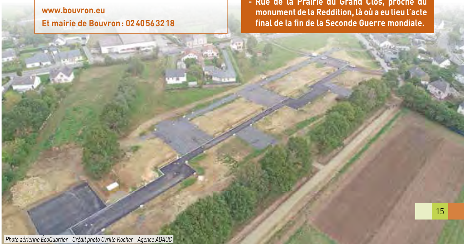
Photo aérienne ÉcoQuartier

- Rue de la Prairie du Grand Clos, proche du monument de la Reddition, là où a eu lieu l'acte final de la fin de la Seconde Guerre mondiale.