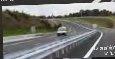
La première voiture