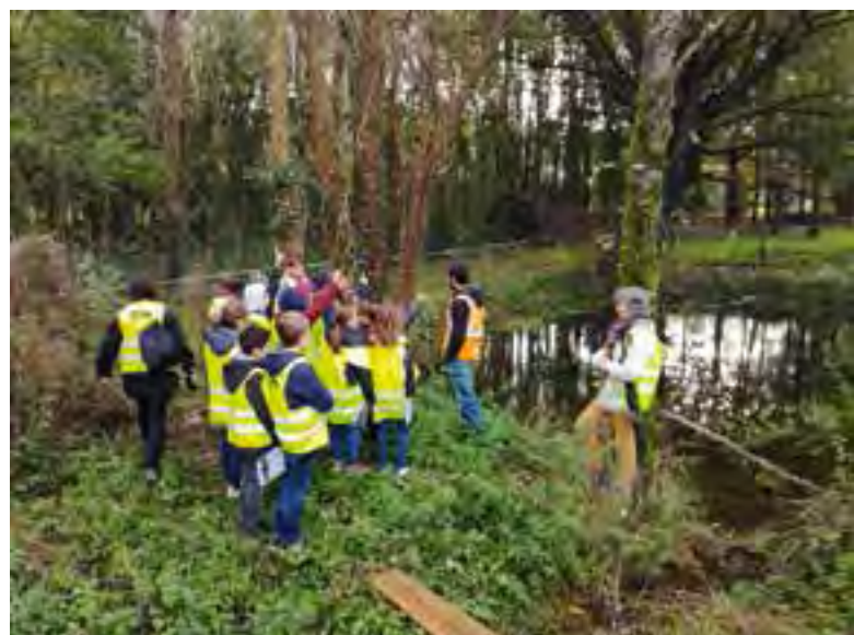
Visite des CM1 et CM2 de l'école Saint-Sauveur près d'une mare réaménagée au Friche Blanc