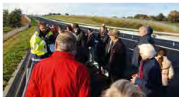
Une centaine d'habitants a profité de la visite commentée de la construction de la déviation et des mesures environnementales compensatoires qui ont été réalisées