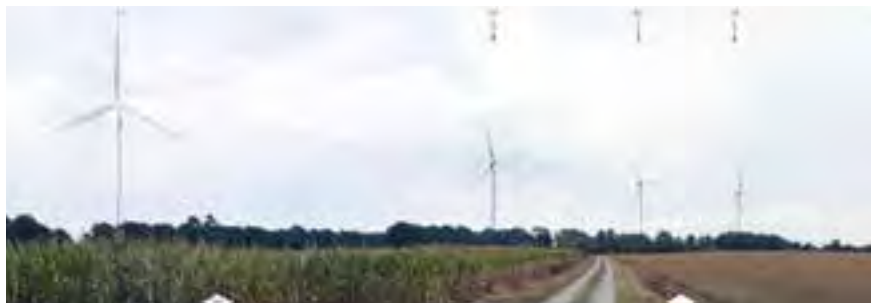
Image virtuelle d'implantation sur site